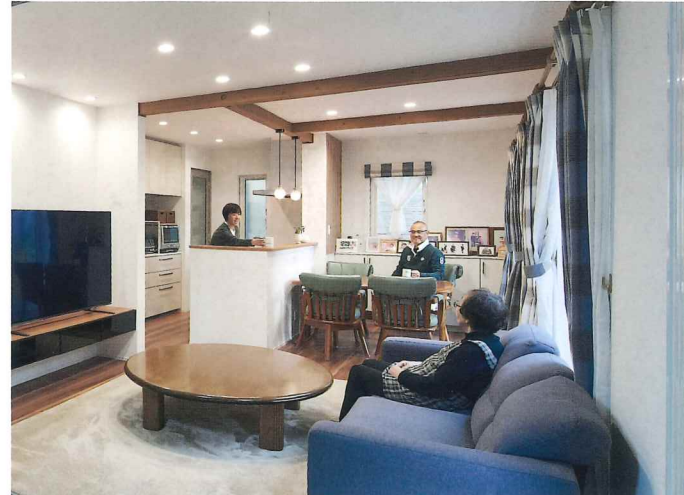
1階リビングはみんなが集まる憩いの場! 大きな梁がアクセント