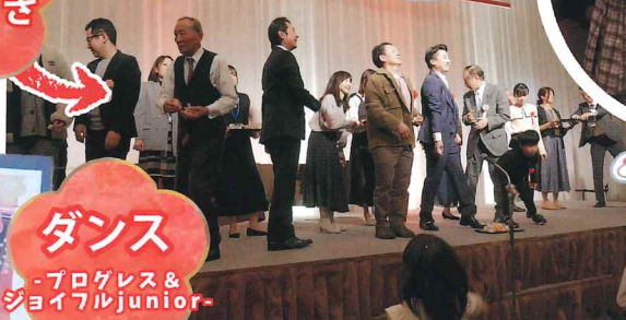
ダンス -プロGRESS& ジョイフルjunior-