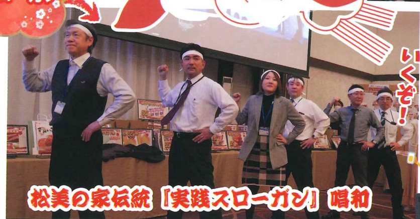
松美の家伝統「実践スローガン」唱和