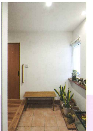
1階H様世帯の玄関ホール。