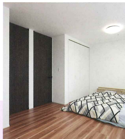
2階洋室。将来は子供部屋に。成長に合わせて仕切る予定