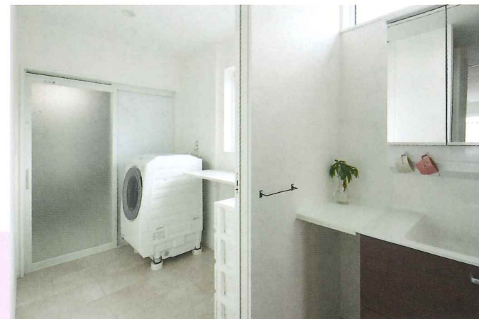
2階水廻り。脱衣所、洗面所は別々。洗濯、脱衣所では洗濯→干す→畳むが移動なく完結