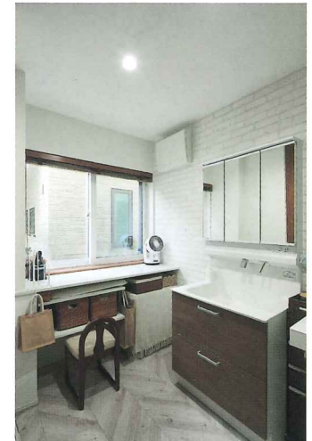
1階洗面。広々して快適!