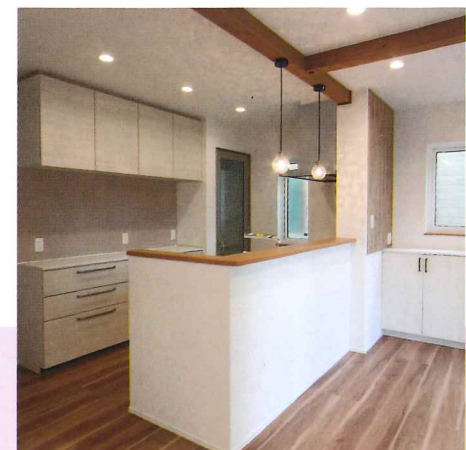
1階キッチン。カウンターを少し高くし目隠しに！