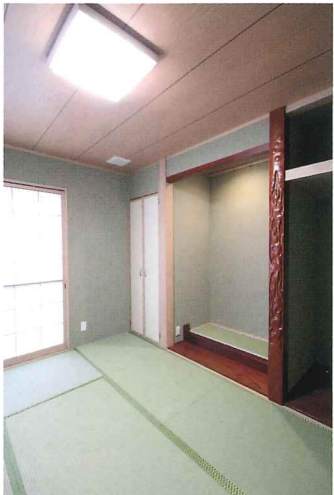
1階リビングに隣接した和室