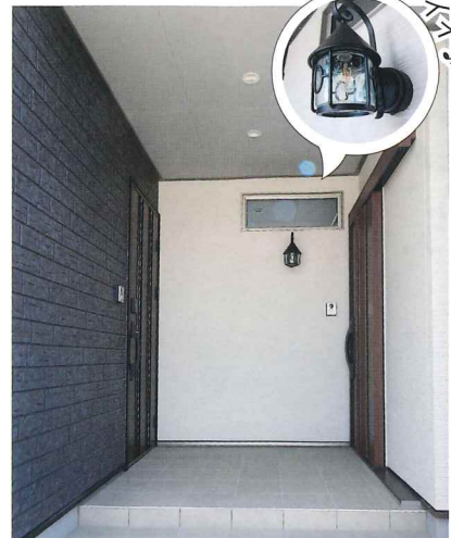
玄関から別々の完全分離型二世帯住宅