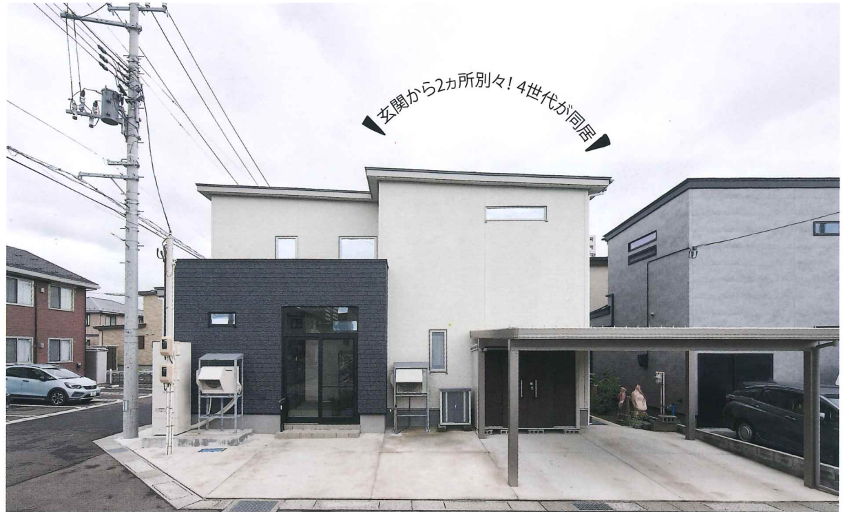
スッキリしたデザインの外観。車4台置ける駐車場