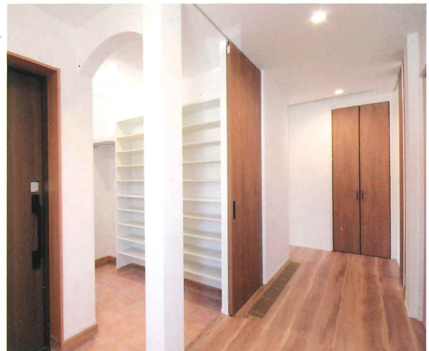
1階H様世帯の玄関(写真は新築時) 広々してスッキリ!