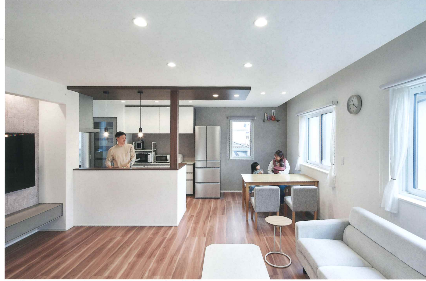
白を基調とした明るい2階のLDK。キッチン上の下がり天井がアクセントになり、カフェのようなオシャレなデザイン!

リビングと隣接した部屋は将来自分たちの主寝室として造りました。子どもが小さいうちは遊び場だったり、リビングとしても広く活用できています。子供部屋は2間続きにし、今は寝室にしています。子どもの成長に合わせて将来、仕切る予定にしています。」