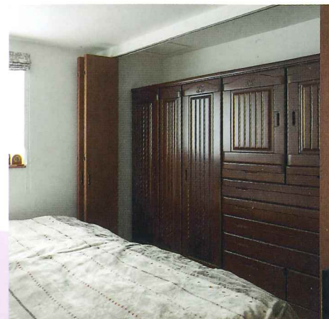
1階寝室。婚礼準備も収納出来てスッキリ！