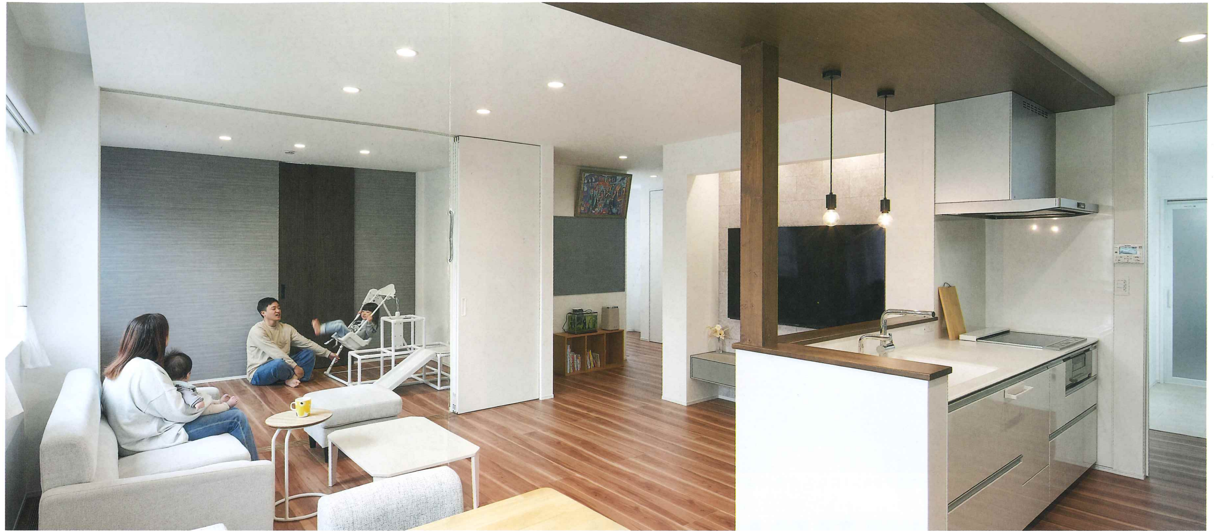
キッチンから全て見渡せるLDKはお子様を見守りながら家事ができて安心です