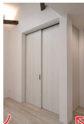
扉を閉めて個室にも!