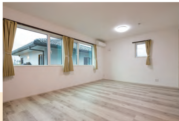
子供部屋。成長に合わせて2部屋に仕切れる設計