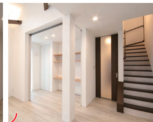
扉を開けると、リビングと一体感のあるワークスペースに