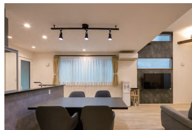
食事の時間を家族でゆったり過ごせるダイニング