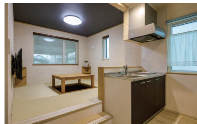
親世帯のくつろぎ空間。ゆったり過ごせる和室リビング。