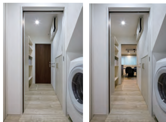
2世帯の動線が交わる位置に水回りを配置。建具を開けると動線、閉めると脱衣所になる。

【松美の家に住んでみて】 「とても快適です。冬でも家中があたたかく、薄着で過ごせます。全館床暖房は子どもにも親にもやさしいですね。暖房器具を置かなくて済むので安全面でも安心ですし、どの部屋にいても温度差がないのは本当に快適です。また、両親がすぐそばにいてくれるので、子育てにもいい環境だと思います。新築後は家にいる時間が増えました。居心地が良くて、家族みんなが自然と家でゆっくりするようになりました。」