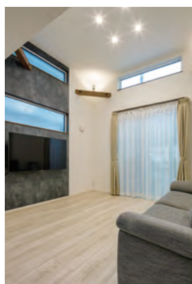
開放的な吹き抜け