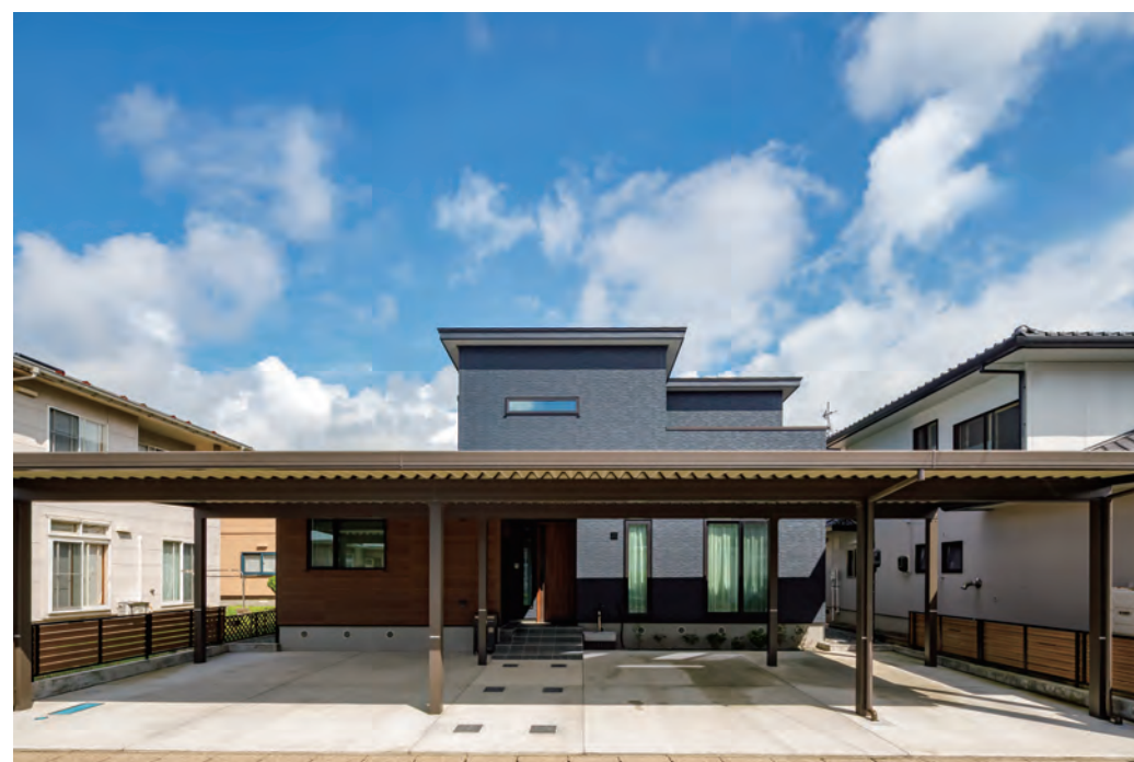
4台駐車可能なゆったりカーポート!黒×ウッド調の外壁がスタイリッシュに調和。