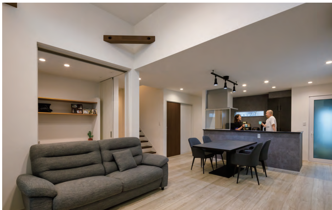
広々LDK。吹き抜けの開放感と隣接したワークスペースでゆっくりできそう!

2階にも洗面を付けました。朝の準備が重なるので広くして並んで身支度できるようにしました。また親世帯は一階を使用することで一緒にいることなく、自分たちのペースで使えるので助かっています。」