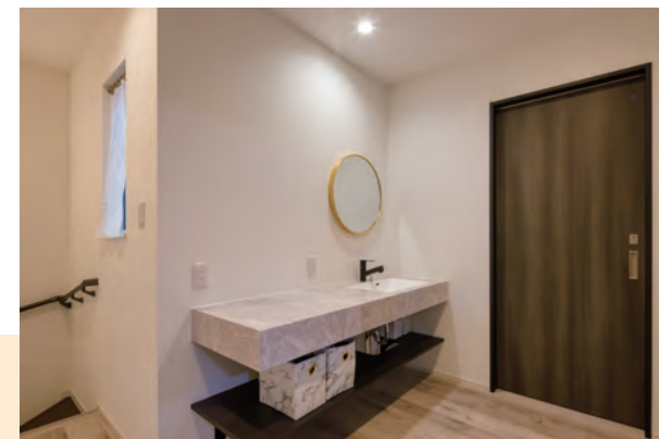
忙しい朝も自分のペースで使える洗面スペース