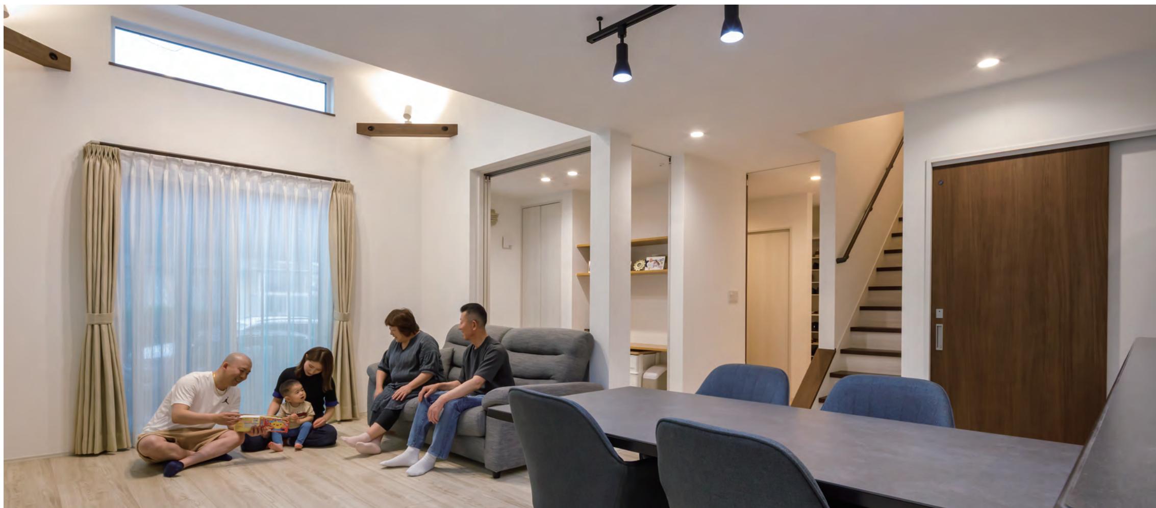
家族が自然と集まり、笑顔があふれるリビング